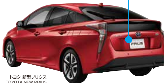
トヨタ 新型プリウス TOYOTA NEW PRIUS

High power AC inverter attracting attention as an emergency power supply in a time of disaster