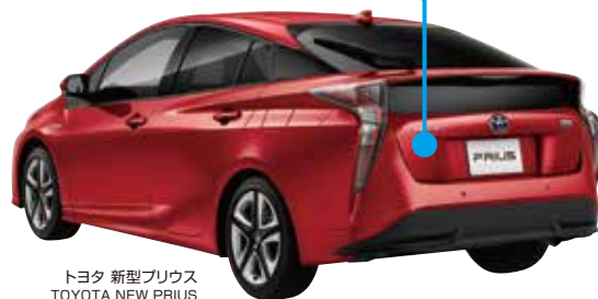
トヨタ 新型プリウス TOYOTA NEW PRIUS